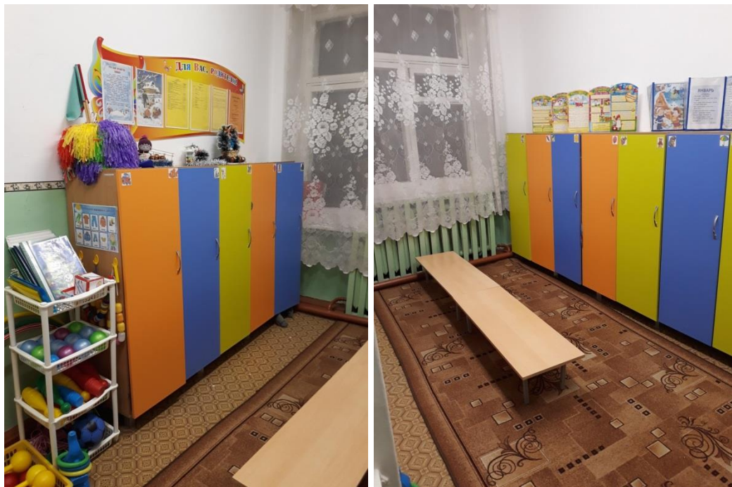
Средняя группа № 6