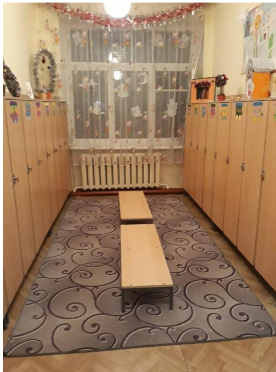
Старшая группа № 3