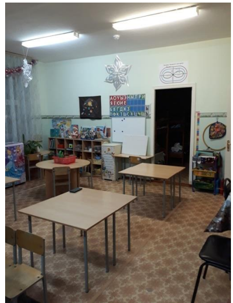
Средняя группа № 4