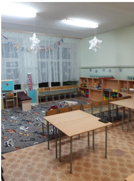
Подготовительная группа № 5