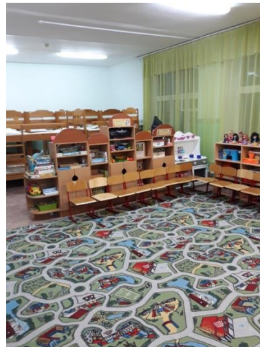
Средняя группа № 6