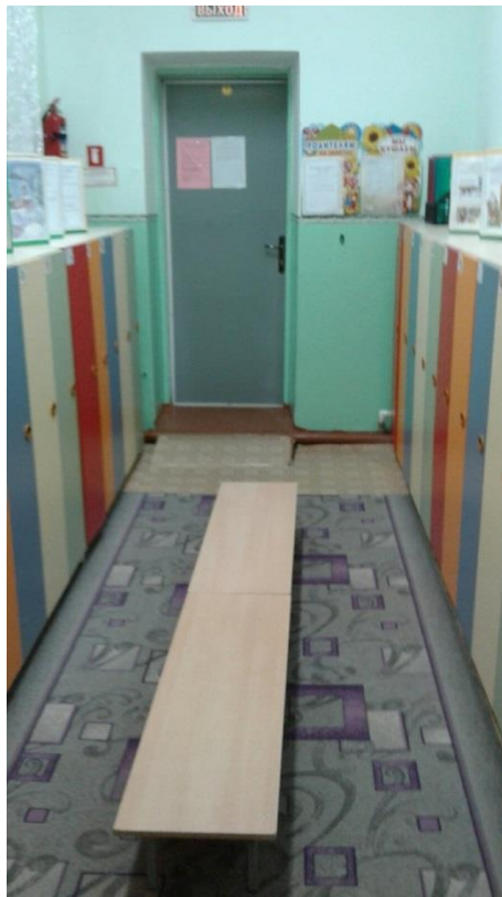
Средняя группа № 4