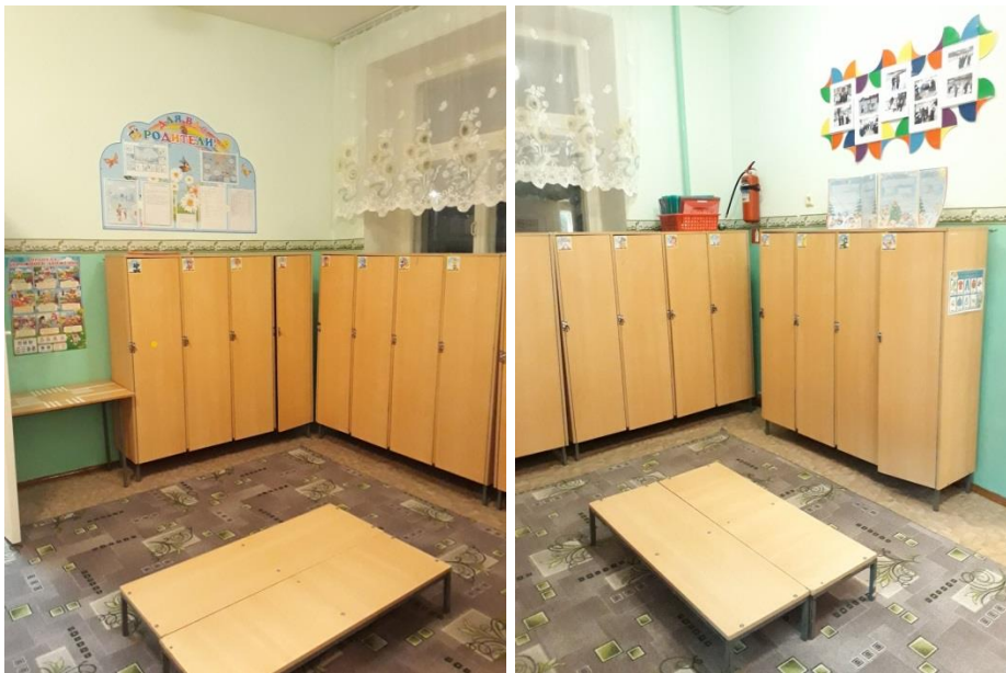
Подготовительная группа № 5